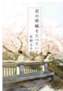
『君の臓腑をたべたい』