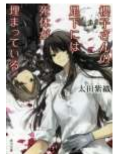
『櫻子さんの足下には死体が埋まっている』