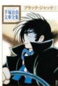
『ブラック・ジャック』